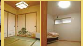
居室(和室) 居室(洋室)